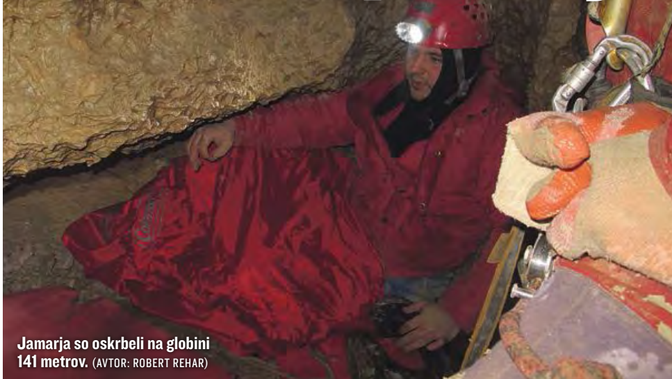
Jamarja so oskrbeli na globini 141 metrov. (AVTOR: ROBERT REHAR)

AJDOVŠČINA ◉ V soboto v zgodnjih jutranjih urah so iz jame v Otlici potegnili ranjenega jamarja.