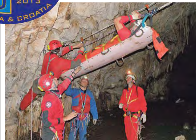
JAMARSKA REŠEVALNA SLUŽBA SLOVENIJE