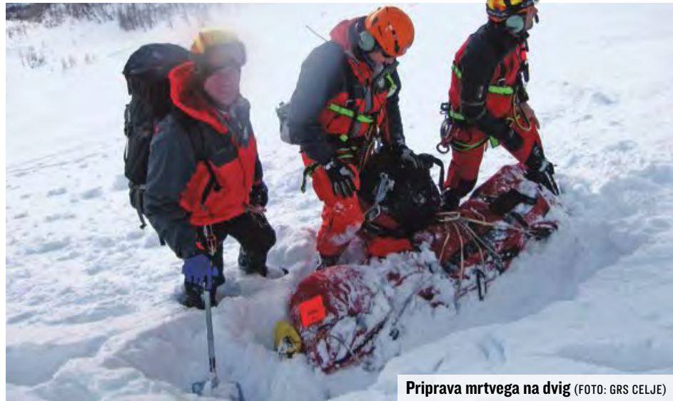
Priprava mrtvega na dvig