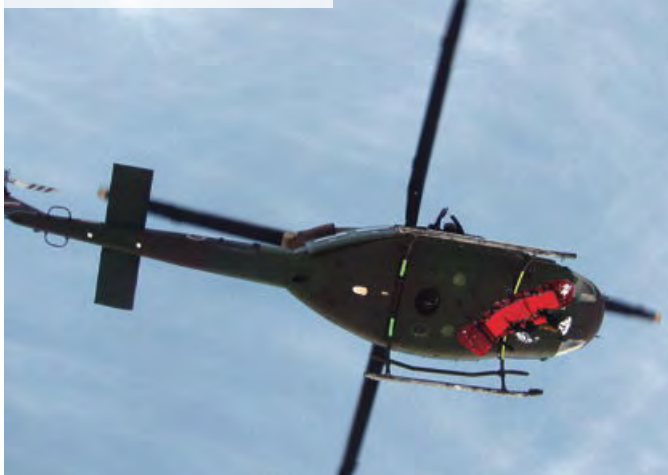
Štajerska ekspres na severnem pobočju Brane je znova zahtevala smrtni davek.

SLOVENSKA BISTRICA – Domači gasilci so včeraj posredovali na gradu, kjer je zaradi počene vodovodne cevi poplavilo sanitarne prostore.